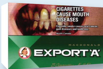
Figure 1. Emballage de cigarettes actuel au Canada par rapport à des exemples d'emballage neutre

Dans de nombreux pays, l'emballage des produits du tabac est devenu « le véhicule promotionnel le plus important pour atteindre les fumeurs actuels et potentiels, ». La conception de l'emballage peut faire paraître sécuritaire l'utilisation de son contenu, ce qui compromet la crédibilité et l'efficacité des mises en garde de santé. Des études indiquent que la couleur, la forme et la taille d'un paquet peuvent avoir des répercussions sur le comportement des consommateurs et la perception des attributs du produit. La Convention-cadre pour la lutte antitabac (CCLAT) de l'Organisation mondiale de la Santé (OMS) recommande d'adopter un emballage neutre pour a) réduire l'attrait des produits du tabac, b) augmenter la visibilité et l'efficacité des mises en garde et messages de santé, et c) réduire les techniques de conception susceptibles d'induire les consommateurs en erreur quant à la nocivité des produits du tabac.